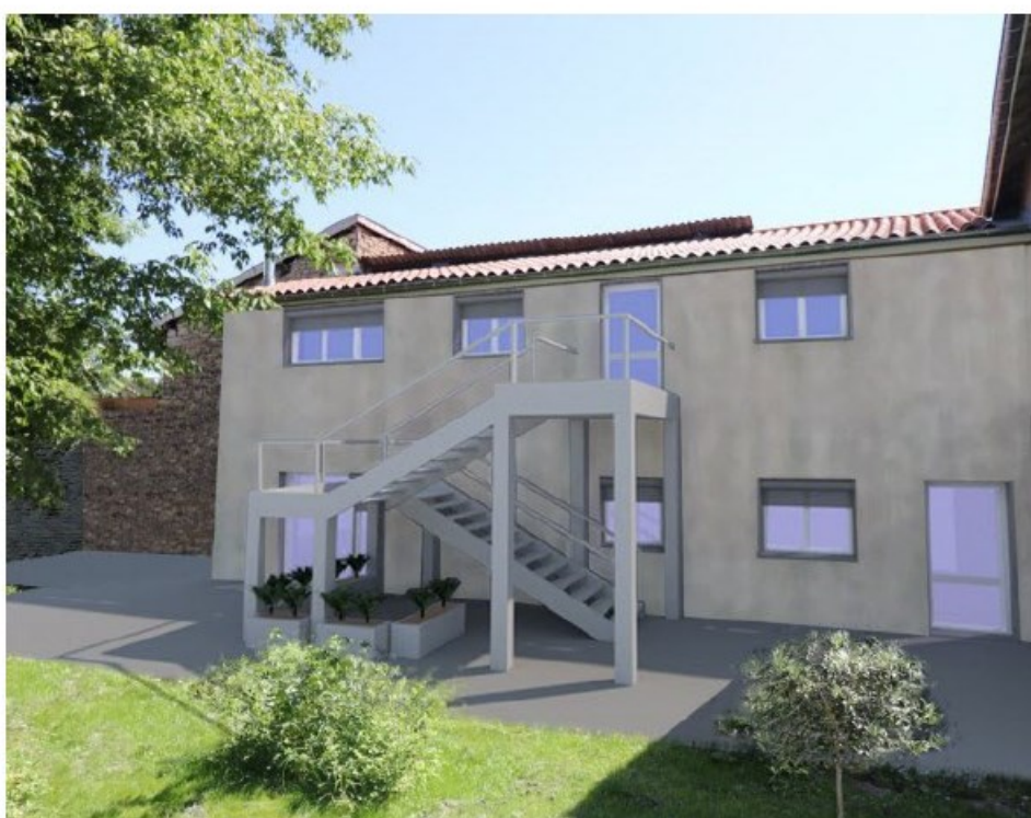
ISCL Bourgoin, côté parc.

Paris, Lyon, Marseille, Lille, Bordeaux, Toulouse, Grenoble... Toutes les grandes villes ont leur CFA d'enseignement supérieur. À la rentrée de septembre, Bourgoin-Jallieu pourra s'enorgueillir de disposer à son tour du sien, avec l'ouverture de l'Institut supérieur du commerce et de la logistique (ISCL).