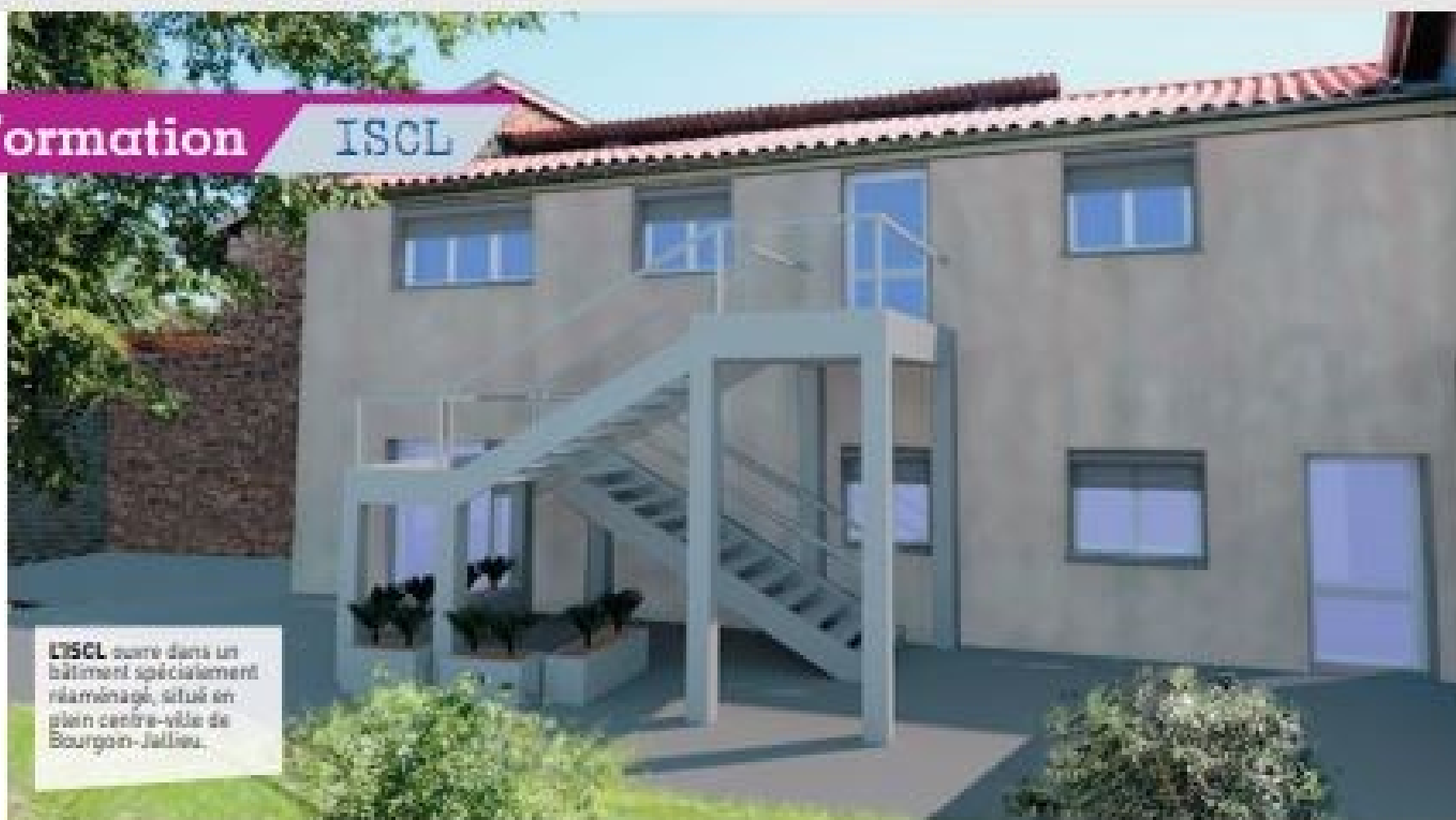
L'ISCL ouvre dans un bâtiment spécialement réaménagé, situé en plein centre-ville de Bourgoin-Jallieu.

tiques en France. C'est même le deuxième pôle du secteur à l'échelle de l'Europe. L'école se trouve en plein centre-ville, à proximité de tous les commerces et à une centaine de mètres d'un square. Le bâtiment a été rénové pour abriter six salles de cours et des espaces de détente en intérieur et en extérieur. Dès la rentrée 2021, l'ISCL accueillera une soixantaine d'étudiants, pour l'essentiel en alternance sous contrat de professionnalisation. En 2022, les effectifs globaux devraient grimper à 140. Au programme de l'école, une offre diplômante complète : trois BTS, un bachelor (trois en 2023), un master dès 2022 et un MBA fin 2021 ou début 2022. « Les formations en logistique sont souvent opérationnelles, mais rarement commerciales. Mon MBA conjuguera