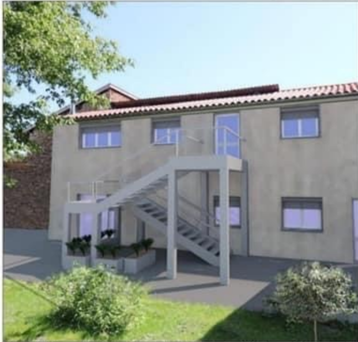
L'ISCL s'installera rue de la Rivoire où les premiers travaux devraient débuter courant février.

Et c'est tout naturellement qu'elle a jeté son dévolu sur Bourgoin-Jallieu. Un lieu stratégique à bien des égards : « Le Nord-Isère concentre à lui seul le plus grand nombre d'entreprises traitant dans la logistique en France. Il est même deuxième au niveau de l'Europe ! S'installer ici est une évidence », poursuit